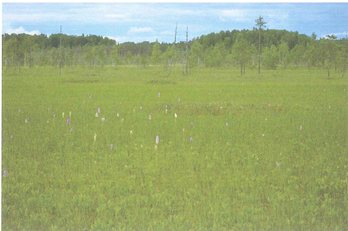
6. Цветение орхидных растений на осоковой топи. Сидоренко М.В.