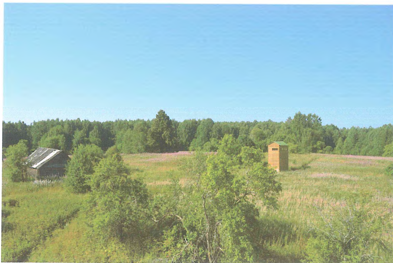
2. Последний дом Староселья. Вид с вышки. Сидоренко М.В.