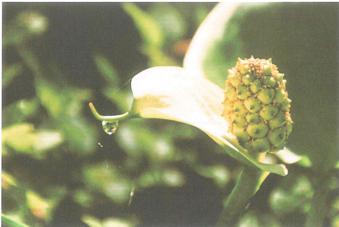
5. Белокрыльник болотный в зоне осоковой топи. Конюхова А.М.