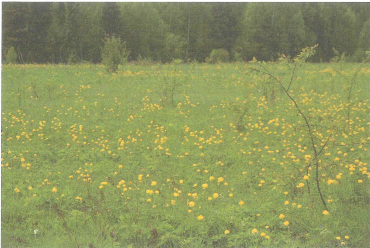
3. Купальница европейская на Старосельском лугу. Янин В.В.