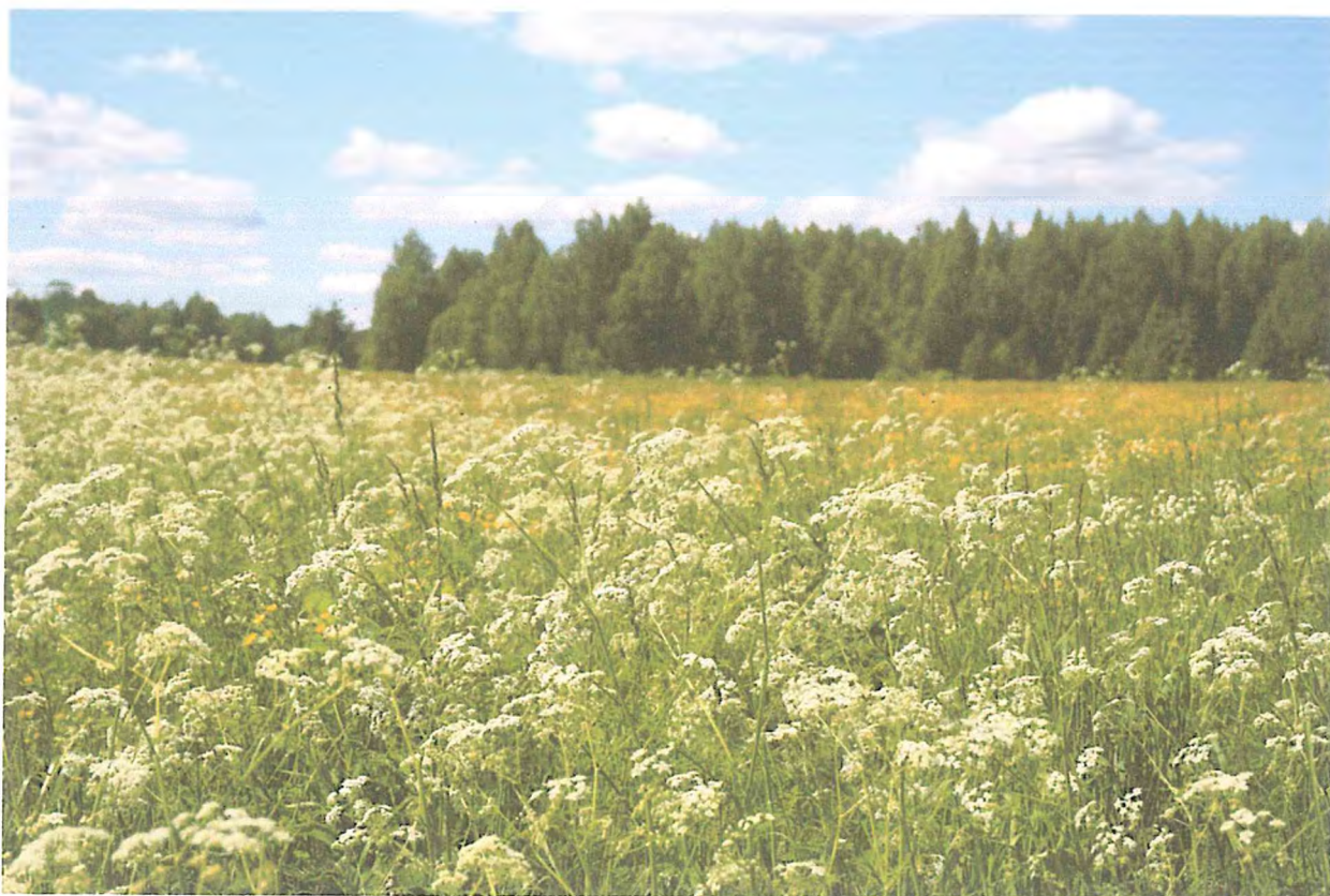
1. Цветение купыря на Старосельском лугу. Сидоренко М.В.