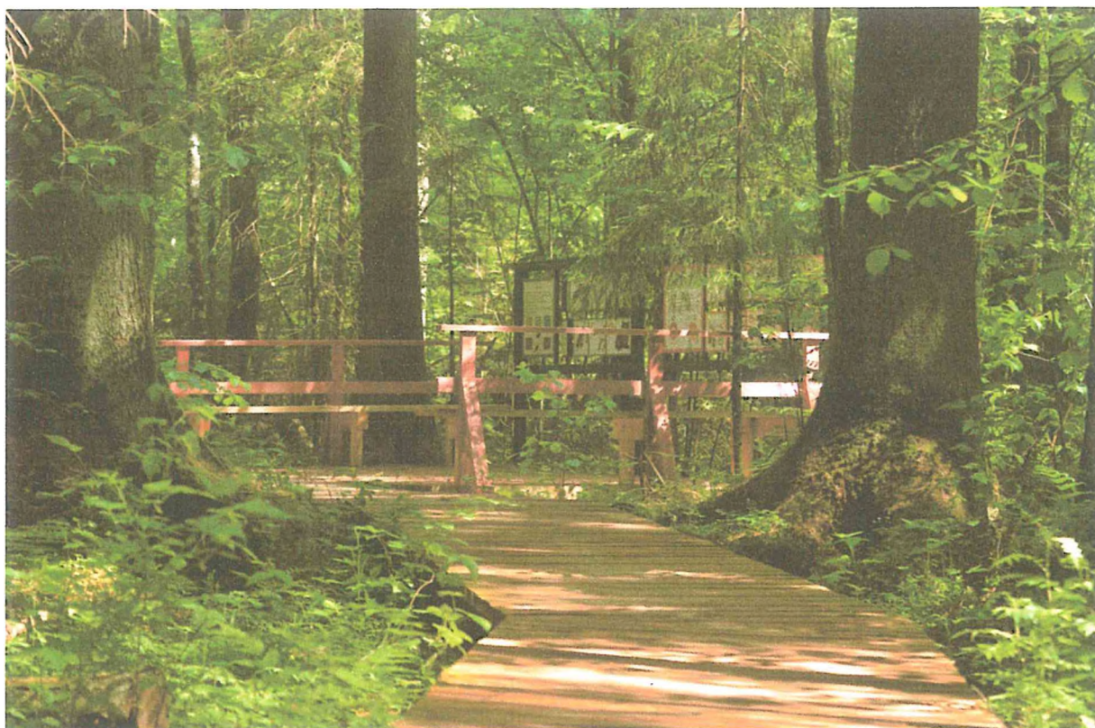
3. Место отдыха №2 на экотропе «Лесная азбука» Сидоренко М.В.