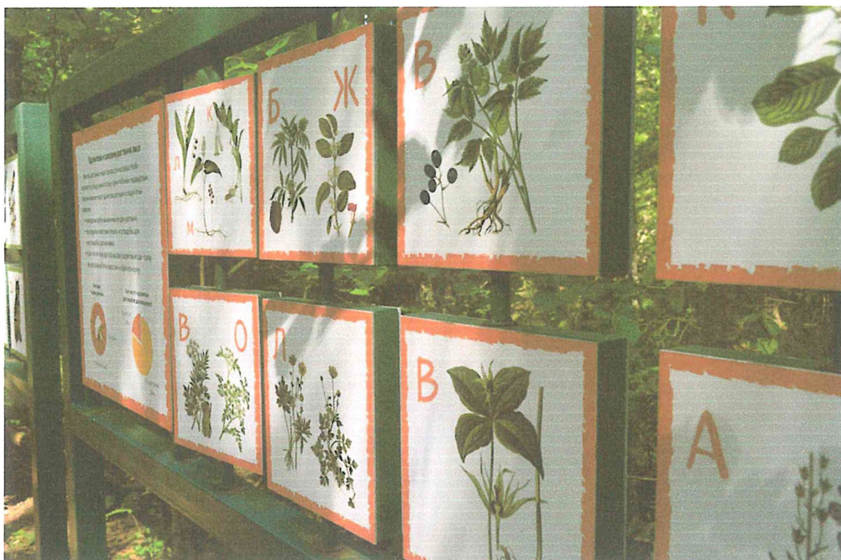
4. Информационные стенды на экотропе «Лесная азбука» Сидоренко М.В.