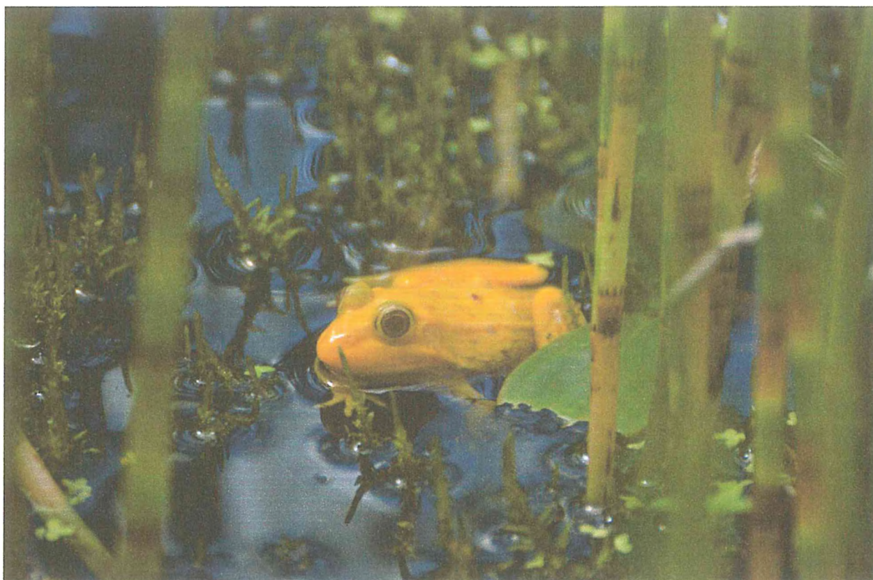
5. Альбинос прудовой лягушки в пруду. Сидоренко М.В.