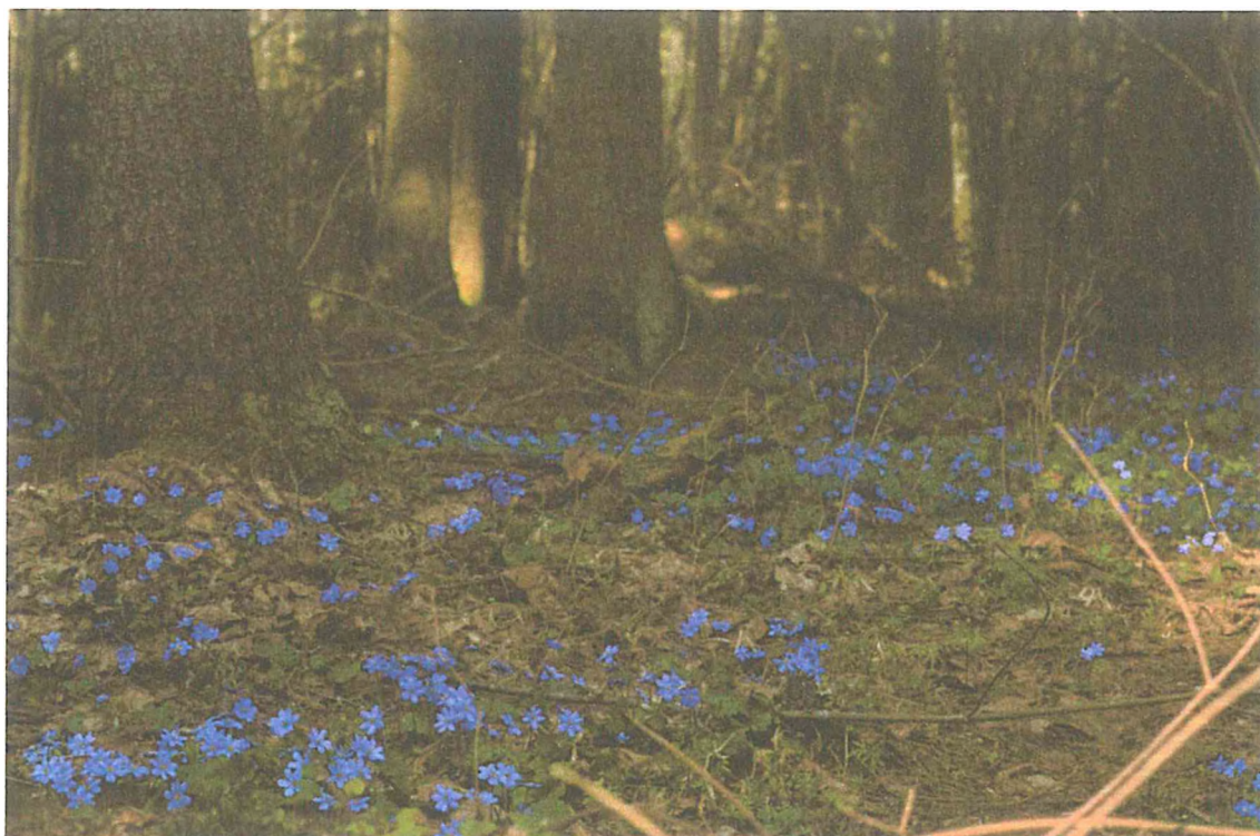
1. Цветение печеночницы в ельнике лещиновом. Сидоренко М.В.